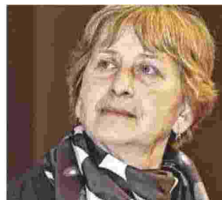
Ol'ga Aleksandrovna Sedakova poetessa, scrittrice e studiosa russa